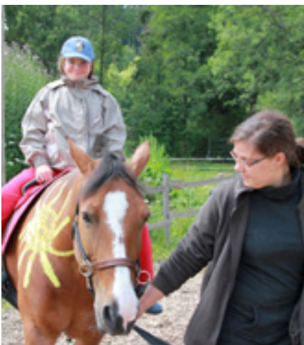
Mach' ich das nicht toll? Alles Glück der Erde liegt für diese kleine Reiterin auf dem Rücken ihres Pferdes.

„Die Kinder sind stolz darauf, wenn sie einmal auf einem Pferd gesessen haben. Das schenkt ihnen neues Selbstvertrauen“, sagt die verantwortliche Diplom-Sozialpädagogin Barbara Reichstein, die zusammen mit fünf jungen Erwachsenen die Kinder betreut. Im September ist ein weiterer Pferdesamstag geplant. Dank der eingegangenen Spenden können die Kosten für Stall, Pferde und die begleitenden Ehrenamtlichen aufgefangen werden. Zudem soll für zwölf Kinder Pferdeputzzeug angeschafft werden – auf dass sie alle glücklich werden auf dem Rücken der Pferde.