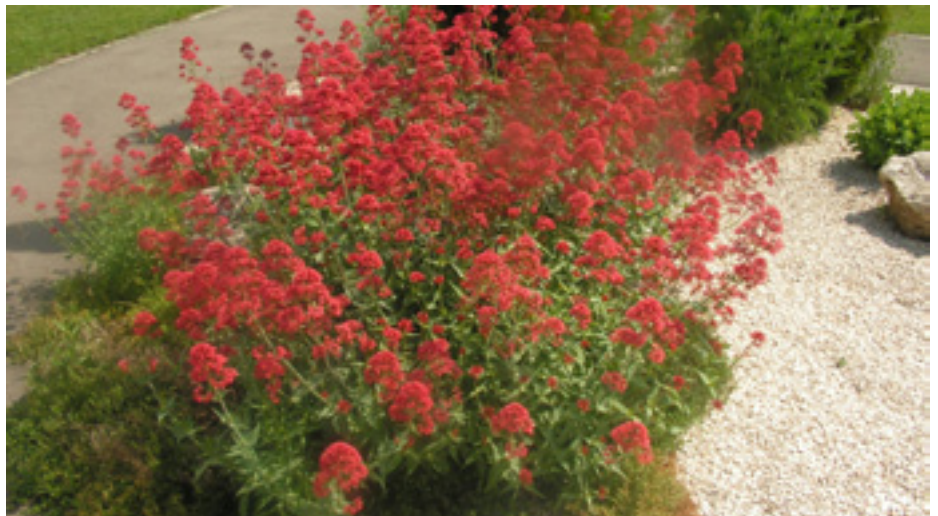
Pflanzen erfreuen und regen die Sinne an.

Beispielhafte Kooperation im Haus St. Antonius in Vogt