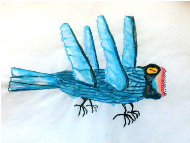
By Kilian Drischel

Für diejenigen, die bereits einen Berufswunsch haben, ist ein Direkteinstieg in die Ausbildung möglich. Ebenso besteht die Möglichkeit, den Wunschberuf zunächst während einer Eignungsabklärung / Arbeitserprobung kennen zu lernen.