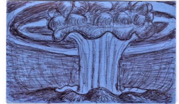
By Kilian Drischel

Ausführliche Informationen finden Sie auf unserer Homepage www.stiftung-liebenau.de/bildung