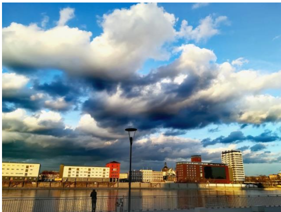
By Kilian Drischel